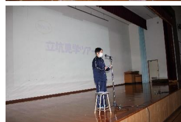
【10・30 総合的な学習発表会より】