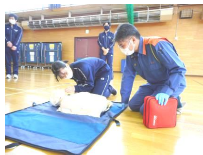
【12・22 救急救命講習より】

最後になりますが、今年の干支は「丑(うし)」です。牛は古くから酪農や農業で人間を助けてくれた大切な動物でした。大変な農作業を最後まで手伝ってくれる働きぶりから、丑年は「我慢(耐える)」、「これから発展する前触れ(芽が出る)」というような年になるといわれています。また、十干十二支でいうと今年は辛丑(かのとうし)。辛いことが多いだけ、大きな希望が芽生える年になることを指し示しているそうです。今、北海道も日本もコロナ禍の中にいます。しかし、これを乗り越えた先に素晴らしい世界が待っていると信じ、様々なことに挑戦し、着実に成長する年になってくれることを願っています。